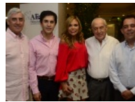
20 años de Alianza Valores